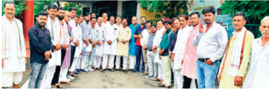
हरिभूमि न्यूज ▶▶ राजगढ़

राजगढ़ शहरी क्षेत्र की सीमा के बीच से गुजर रहे बाइपास के कारण नित नए हादसे हो रहे हैं। बीते एक महीने के दौरान ही बाइपास क्षेत्र में पांच दुर्घटनाएं हो चुकी हैं जिनमें 2 लोग काल के गाल में समा चुके हैं। इन दुर्घटनाओं पर लगाम लगाने नवीन बाइपास का निर्माण अत्यावश्यक हो गया है।