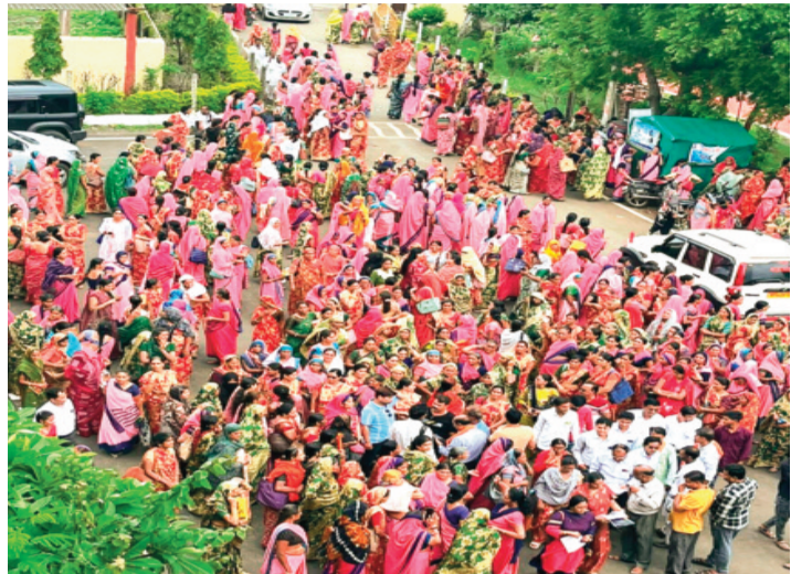
हरिभूमि न्यूज ▶▶ राजगढ़

जिले की विभिन्न आंगनबाड़ी एवं मिनी आंगनबाड़ियों में कार्यरत सैकड़ों आंगनबाड़ी कार्यकर्ता एवं सहायिकाएं सालों से अपनी जायज मांगों को लेकर शासन, प्रशासन से गुहार लगा चुकी हैं। कई बार सौंपे गए ज्ञापन, धरना, प्रदर्शन आदि के बाद भी जब कोई निष्कर्ष निकला तो शनिवार को जिले की समस्त आंगनबाड़ी कार्यकर्ता और सहायिकाएं सामूहिक अवकाश लेकर मुख्यालय पर एकाग्रित हुईं।